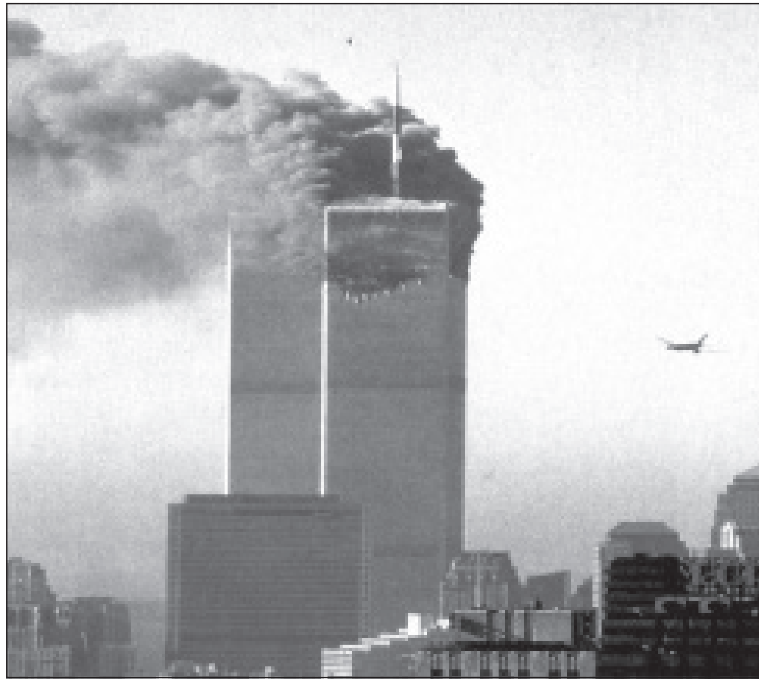
O segundo avião atinge a torre: panorama de destruição sem precedentes

Uma das conseqüências mais sentidas da guerra travada entre os Estados Unidos e o Afeganistão é a obra missionária. Com as fronteiras fechadas e o controle cada vez maior sobre as pessoas, cada estrangeiro passa a ser visto como um inimigo em potencial, especialmente em nações onde o cristianismo já sofre restrições. Segundo informações de organismos internacionais, missionários já estão sendo retirados da zona de conflito e, com o acirramento da guerra, a situação só tende a piorar. Mais do que nunca, é hora de clamar a Deus, tanto pelas igrejas nas áreas afetadas, como pelos líderes mundiais, para que ajam sem ódio e trabalhem pela paz.